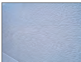
Grain de bois