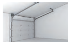
Pente de toit